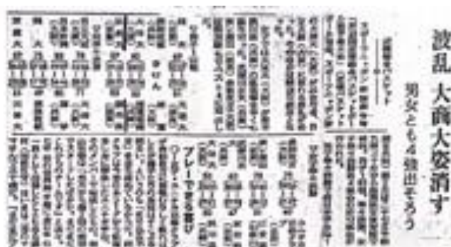
第 23 回近畿総合選手権大会