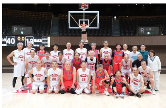
セブンブラザーズ・岡山・広島連合