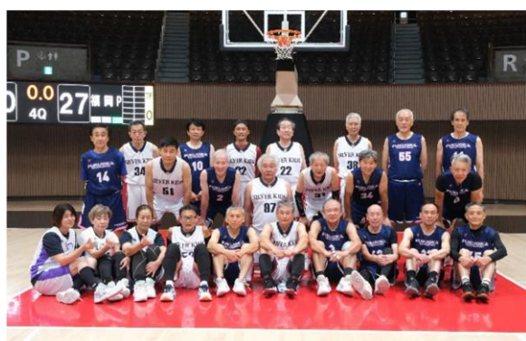
シルバーキッズ・福岡ピンクパンサー