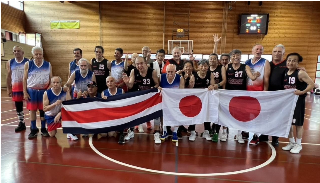
試合後、コスタリカチームと一緒に

年齢を重ねても、スポーツを通じて健康を維持し、国際交流を深め、生涯にわたり挑戦できる場があることを、多くの方に知っていただきたいと思います。