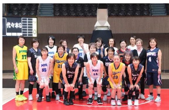
長野クラブシニア・MYC