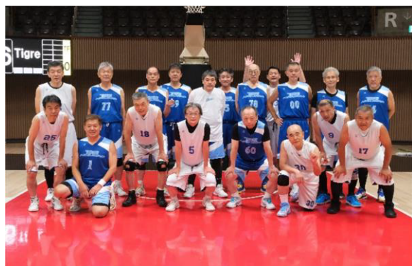
横浜ビーシーガールズ・Tigre Azzuro