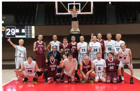
レイダース・駄馬