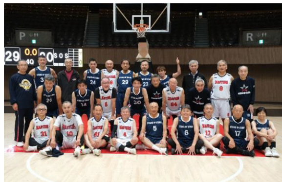
岩手マスターズ・STARS OF STARS